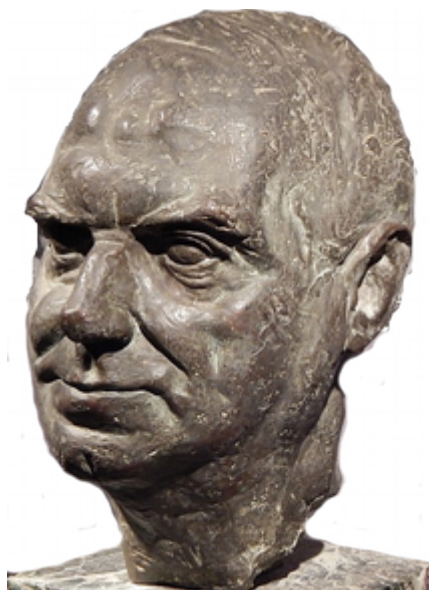
Von Hannes Neuner geschaffene Bronze-Büste Pfarrer Umenhofs. Heute im Besitz des Heimat- und Geschichtsvereins.