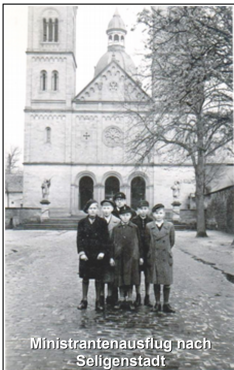
Ministrantenausflug nach Seligenstadt