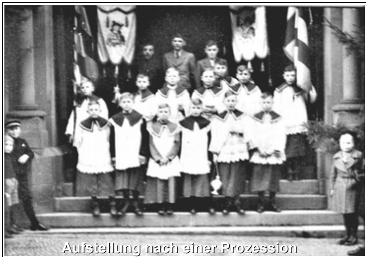
Aufstellung nach einer Prozession