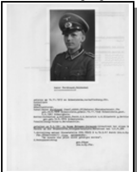
Beispielseite aus dem besprochenen Buch.