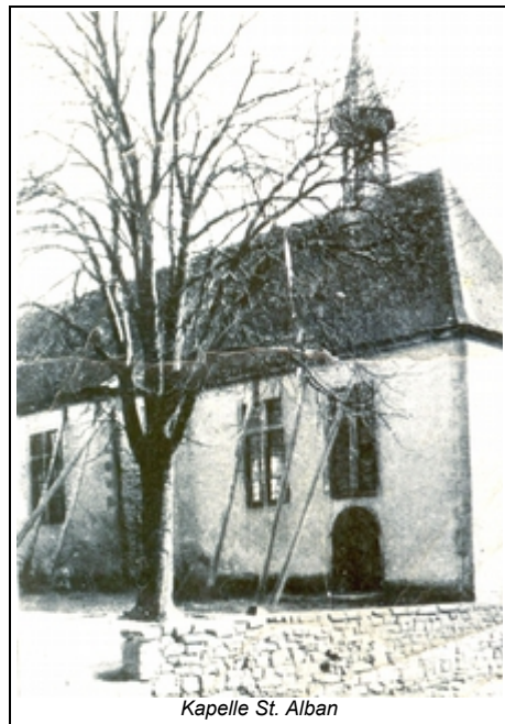
Kapelle St. Alban

Schon im Jahr 1660 wurde in Schweinheim eine Kapelle errichtet, die am Fest Mariä Opferung (21. November) ihre Weihe erhielt. Das Kirchweihfest wurde in Schweinheim bis zum Jahr 1856 daher immer am Sonntag nach Maria Opferung gefeiert. Erst 1856 wurde es für den Bereich der Diözese Würzburg einheitlich auf den zweiten Sonntag im November festgelegt. Die weltliche Kirchweihfeier, „Kerb“ genannt, ist heute noch zur ursprünglichen Zeit. Diese erste Kapelle war dem hl. Wendelinus, dem Patron der Bauern, geweiht. Die Wendelinusstraße in Schweinheim erinnert noch daran. Solange Schweinheim an Sonn- und Feiertagen keinen selbstständigen Gottesdienst hatte, genügte diese Kapelle. Als aber im Jahr