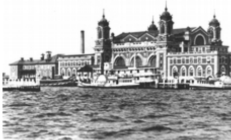
Ellis Island

„Ellis Island (benannt nach einem der früheren Besitzer) ist eine Insel im vom Hudson-River gebildeten Hafengebiet bei New York City. ... Seit 1990 ist die Insel als Museum (Ellis Island Museum of Immigration) zur Geschichte der Einwanderung in die Vereinigten Staaten für die Öffentlichkeit zugänglich. Die Insel war lange Zeit Sitz der